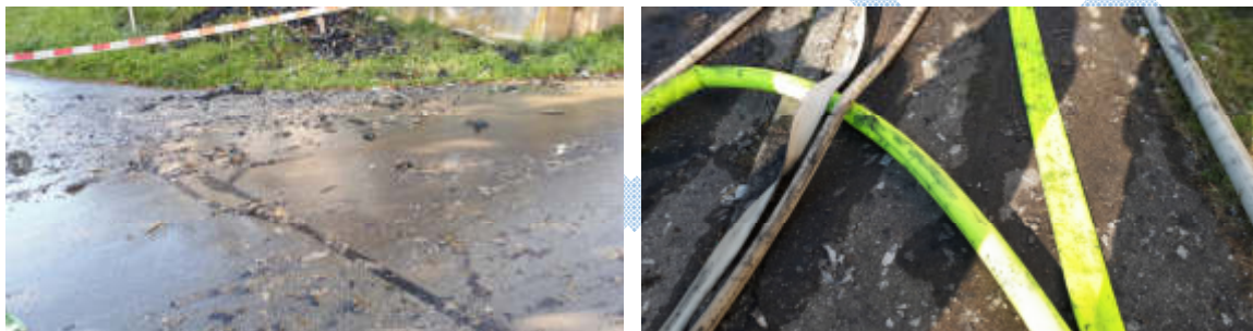
Abbildung 5 - Beispiele einer Asbestkontamination

Belastung können neben Asbestfasern bspw. sein: