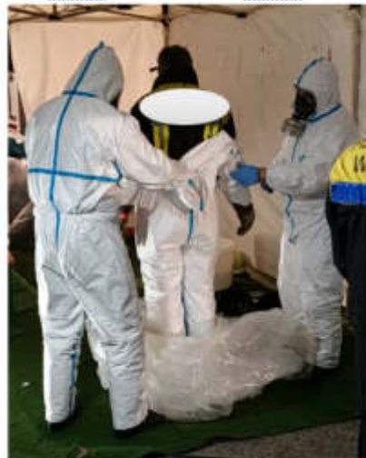
Abbildung 4 - Beispiel Dekon-Platz, Entkleiden einer Einsatzkraft