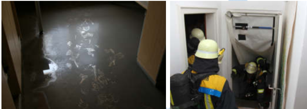
Abbildung 2 - Beispiele zur Kontaminationsverschleppung

Kontaminationsverschleppung vermeiden (Abbruch in Folien einschlagen...).